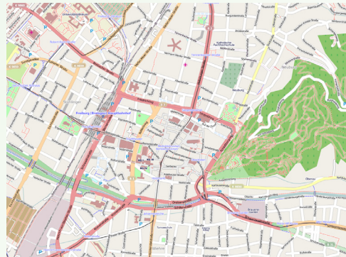
Bild: Freie Geodaten aus „Open Street Map“ http://www.openstreetmap.de